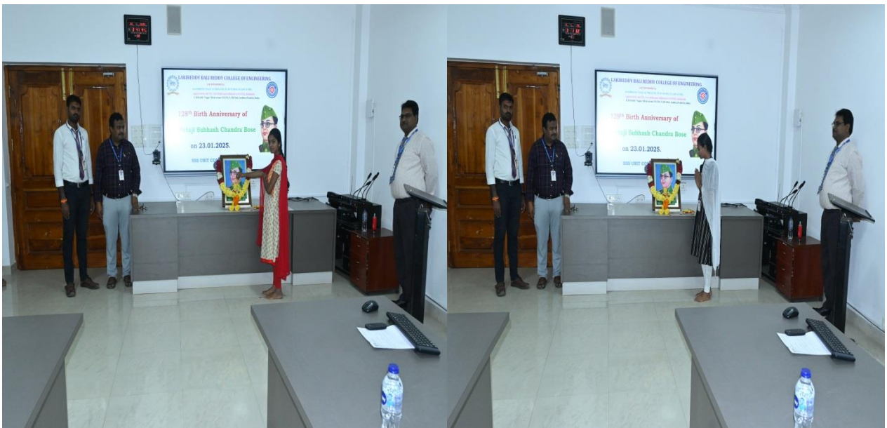
NSS Volunteers paying Tributes to Nethaji Subash Chandra Bose